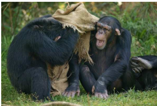
Apprendre à décoder les mimiques des animaux