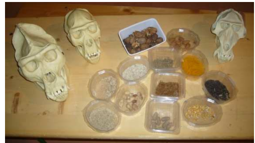
Reproductions de crânes et échantillons des différents aliments donnés aux singes

Participer à des jeux sur le thème de l'alimentation.