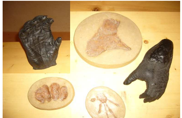
Empreintes et moulages de mains et de pieds

Participer à des jeux sur le thème de la locomotion.