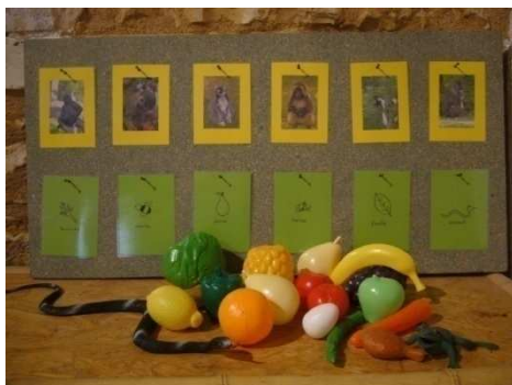
Mise en pratique de la théorie par les enfants