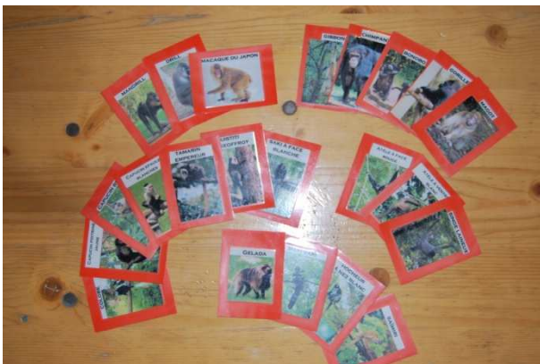
Jeux des ensembles sur les différents types de queues