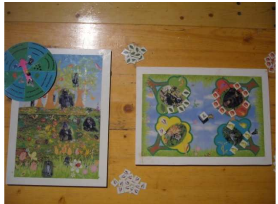
Jeux de société

Observer des singes et remplir une fiche éthologique (pour Collège et Lycée.)