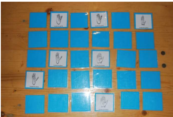
Mémoire des empreintes de singes