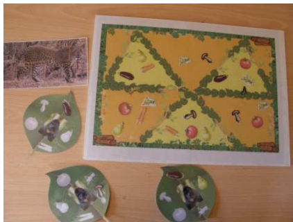
Jeu du Mandrill