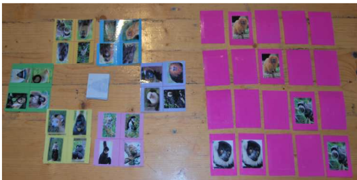
Jeux de mémoire des différentes couleurs de singes et loto couleurs