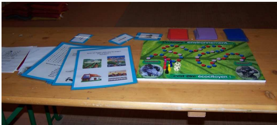
Jeu de l'environnement