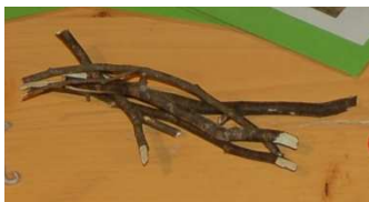
Manipuler des branches imprégnées de l'odeur des animaux