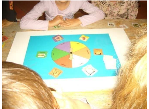
Jeu couleurs des fruits et légumes